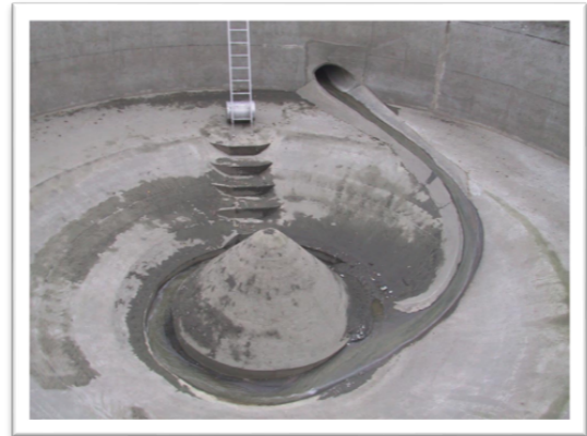
Bassin tampon de Caphar à Nueil-Les-Aubiers